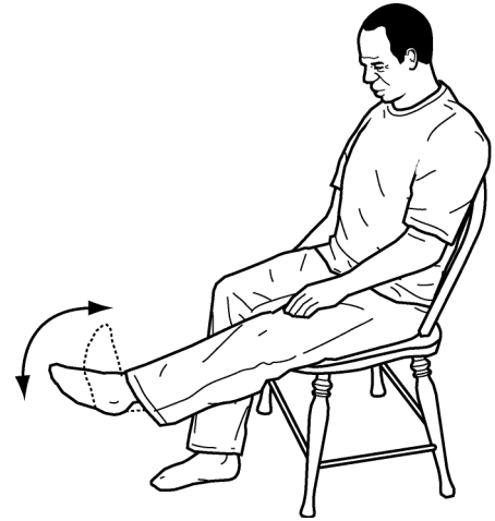
Lumbahin / Bombahin ang bukung-bukong